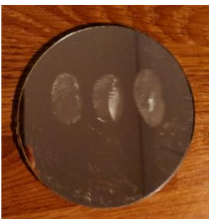
Kuva 1 Sormenjäljet rasvauksen jälkeen.