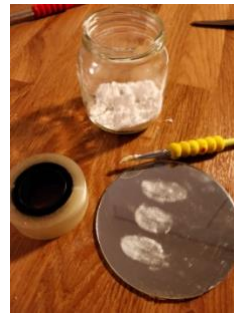
Kuva 3 Nappaa läpinäkyvään teippiin yksitellen sormenjäljet.