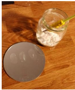
Kuva 2 Laita perunajauhoa sormenjälkien päälle.